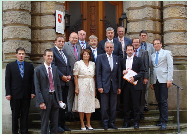
Der Arbeitskreis Recht mit Vertretern der Justiz vor dem Landgericht Stade

geschlossen werden. Für alle Mitarbeiter gibt es eine Perspektive in Bremervörde.