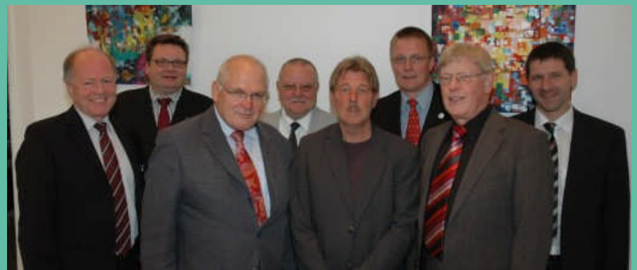
Experten aus Niedersachsen und ganz Deutschland diskutierten die Vorzüge des Gegliederten Schulsystems mit über 200 Gästen

www.cdu-fraktion-niedersachsen.de/schulpolitisches_forum.php