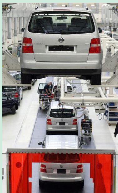
Vom Konjunkturpaket II profitiert die niedersächsische Autoindustrie

Die Regierungserklärung vom Ministerpräsidenten Christian Wulff finden Sie unter www.stk.niedersachsen.de/master/C1499956_N14683_L20_D0_I484.html