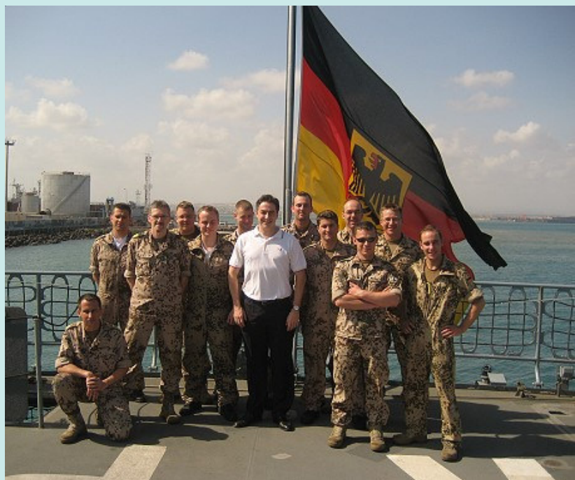
Soldaten des MFG 3 unter Führung von Kapitänleutnant Rainer Naujoks mit David McAllister auf dem Flugdeck der Fregatte Rheinland-Pfalz

Zu einer Begegnung mit Soldaten des Marinefliegergeschwaders 3 aus Nordholz kam es auf der Fregatte Rheinland-Pfalz. An Bord der Fregatte sprach David McAllister mit der Besatzung und der Bordwartungsgruppe eines Hubschraubers SeaLynx MK 88 Alpha.