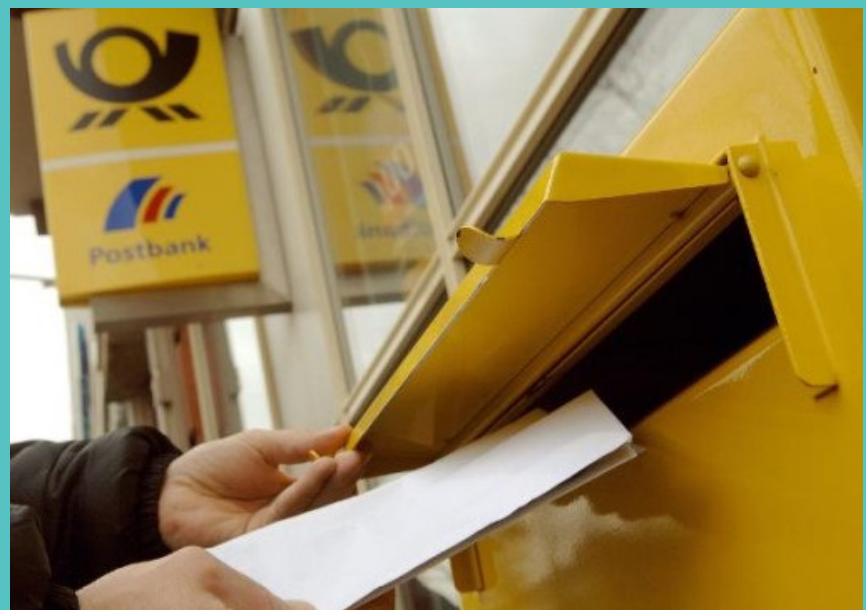
Kein Rückzug aus der Fläche: Die CDU-Fraktion fordert, dass die postalischen Leistungen weiterhin angemessen angeboten werden.